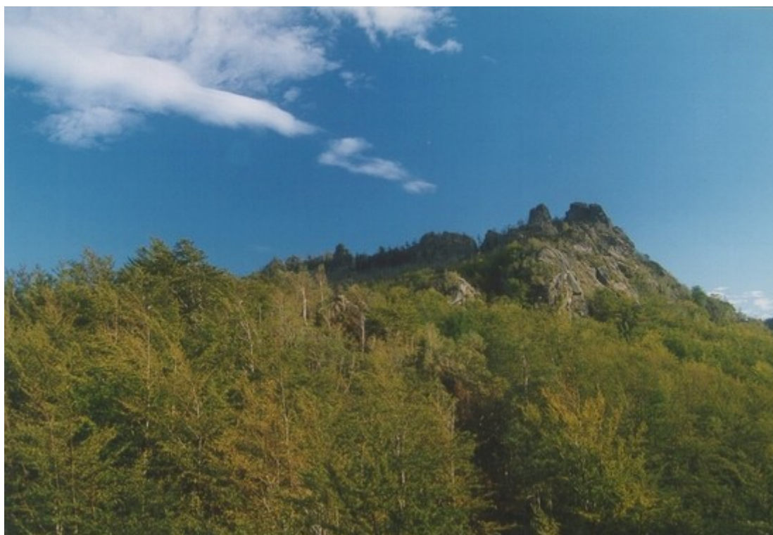
Výhled z Hajního kostela

Navržené úpravy: nátěr zábradlí a žebříku 2004-5