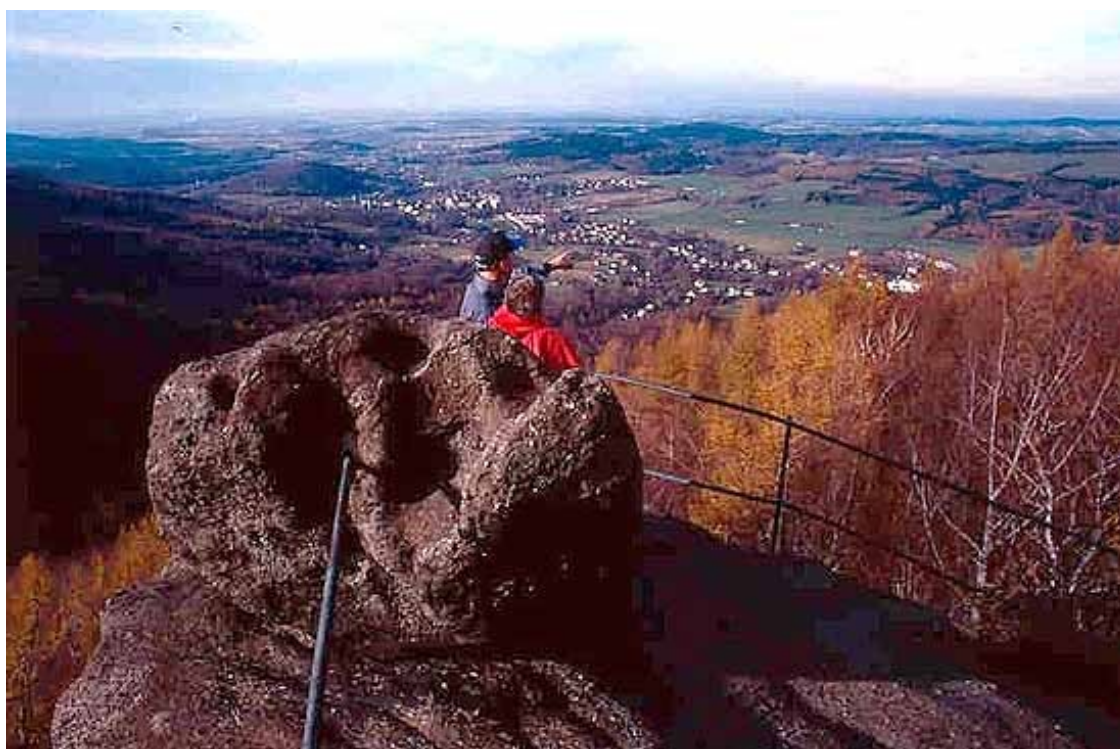
Vrcholová část vyhlídky