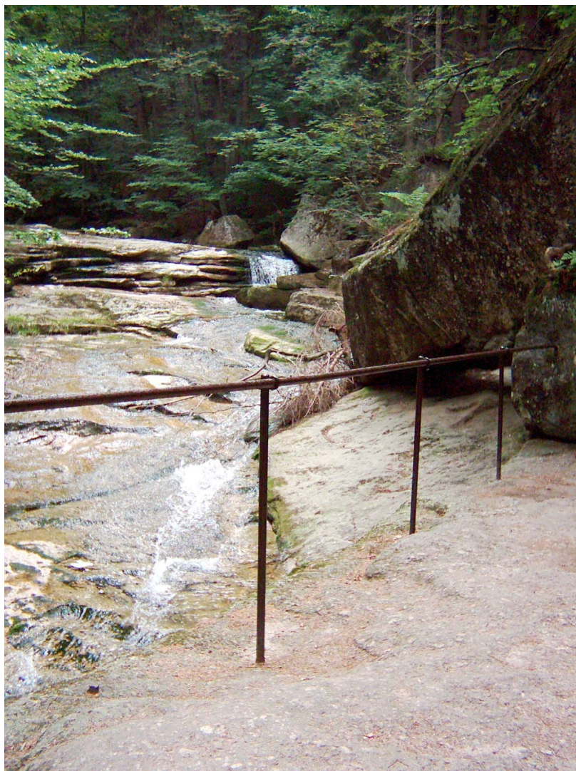
Pohled na dolní vodopád Jedlové