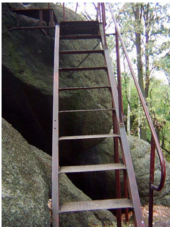
Detail ocelového schodiště