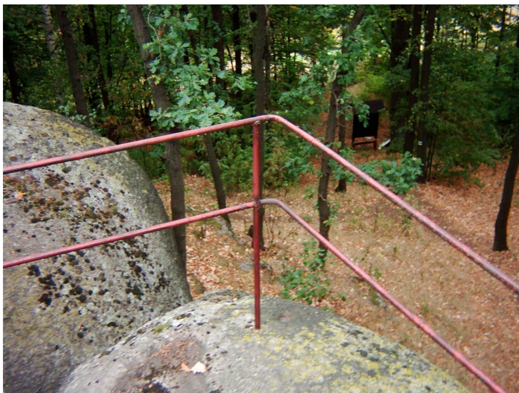
Detail zábradlí na vrcholovém platu