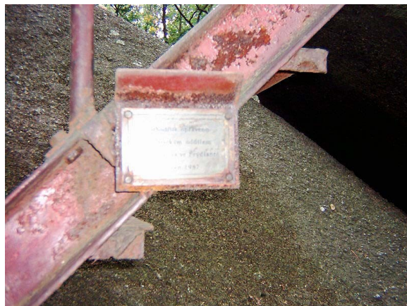
Detail kovové tabulky