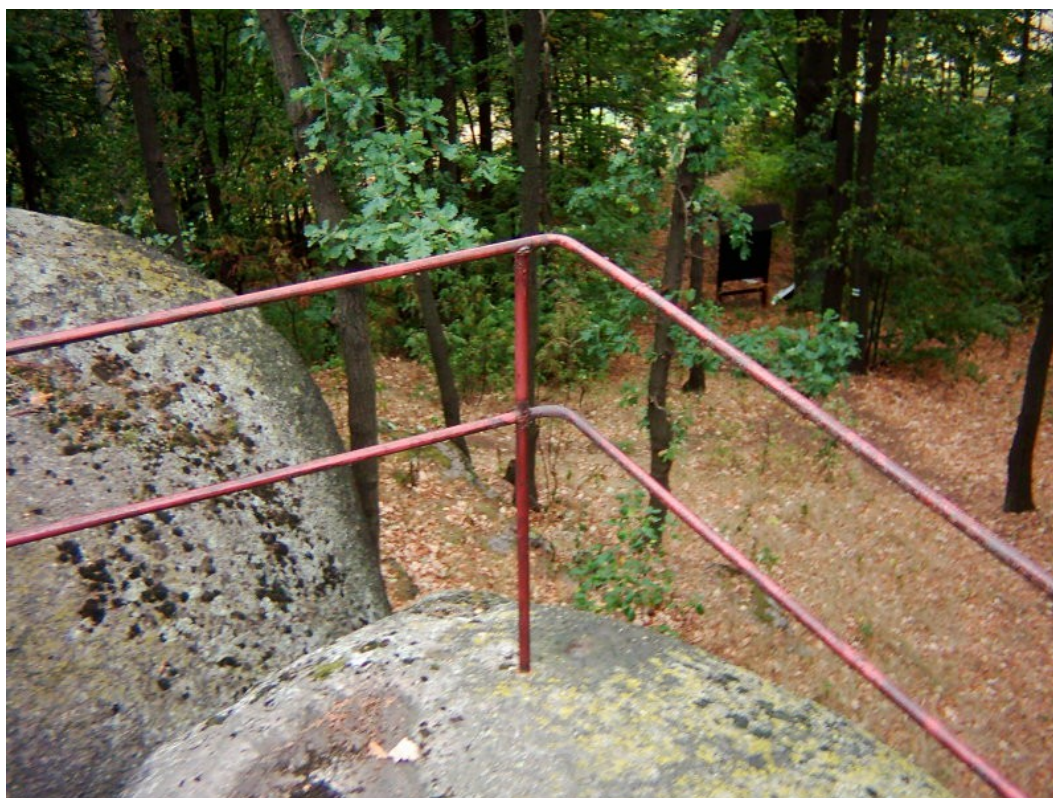
Detail zábradlí na vrcholovém platu