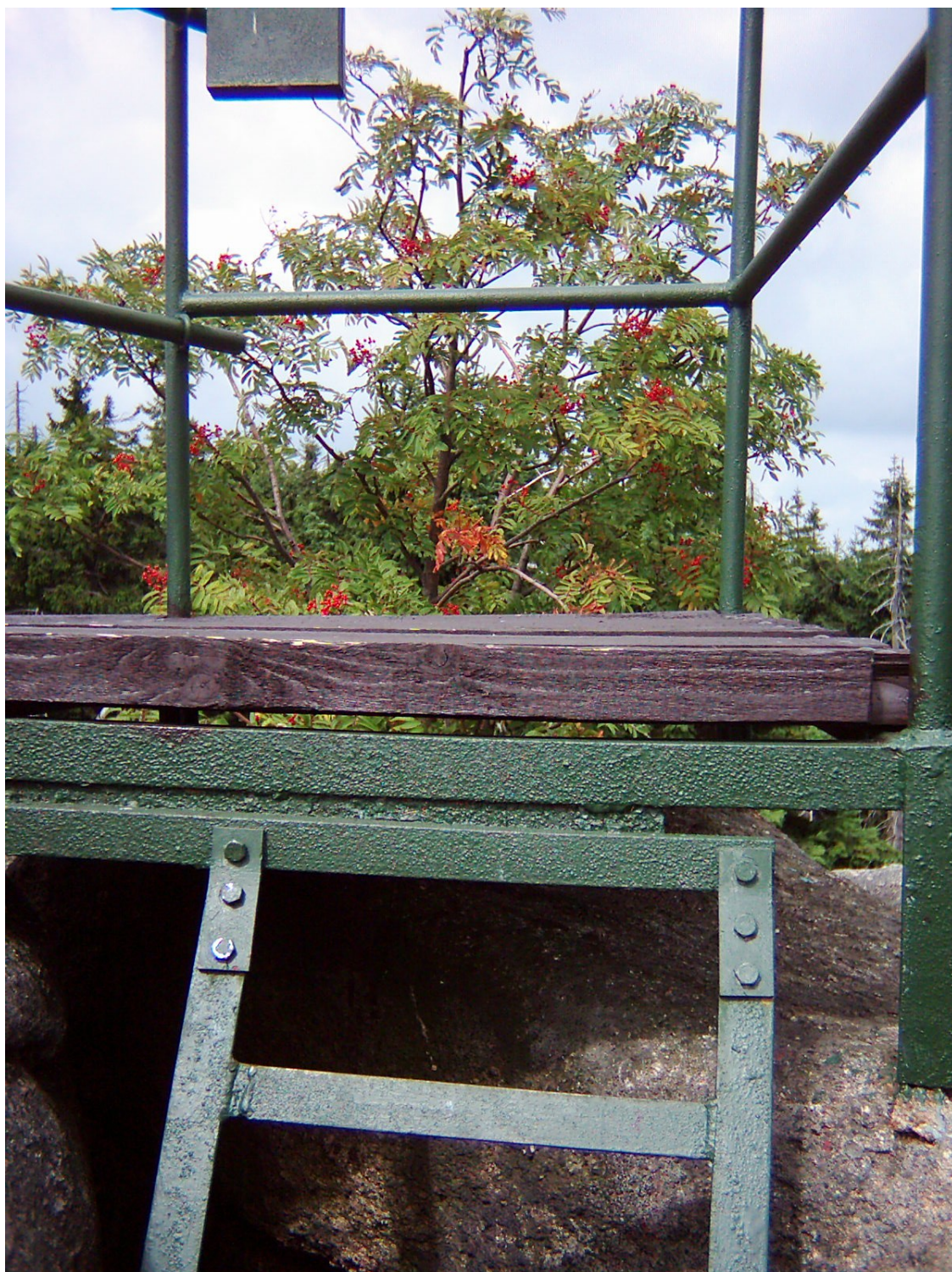
Detail zábradlí vrcholové plošiny