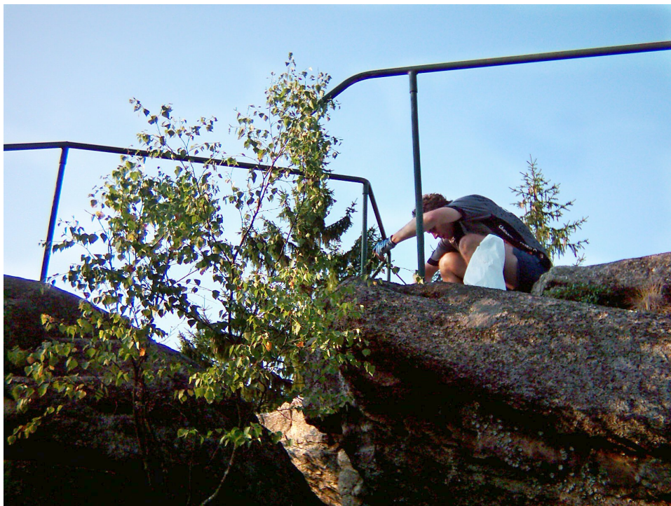
Zábradlí na vrcholu vyhlídky