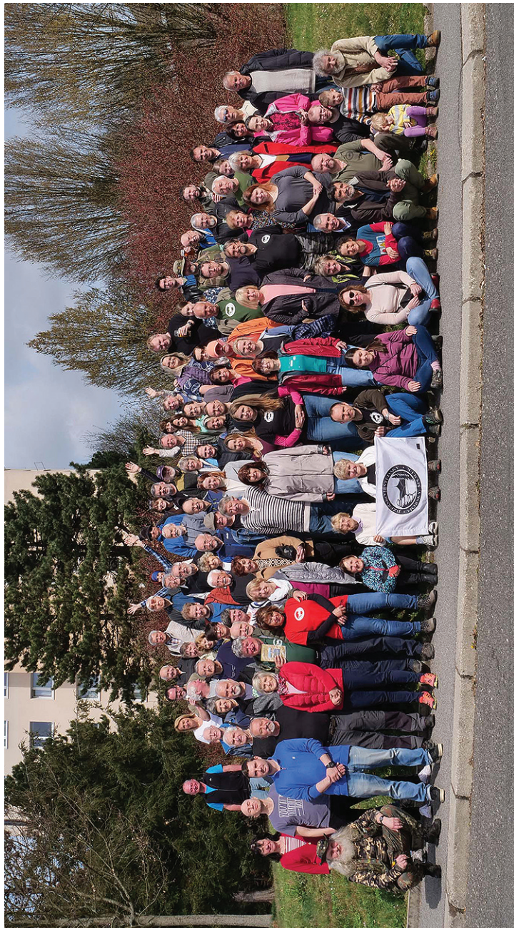
Společné foto z čtyřroční členské schůze před restaurací U Košků 12. dubna 2025