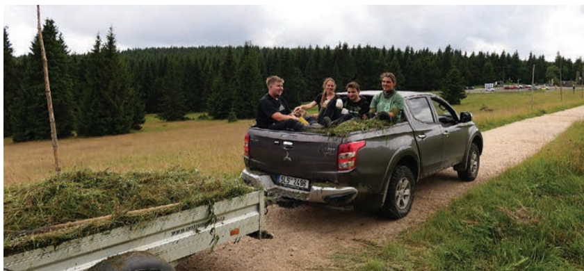
Odvoz trávy z Pralouky na Jizerce

Pozemkový spolek pro přírodu a památky severovýchodních Čech, původně nazvaný Severák, byl založen v roce 2000 jako součást Jizersko-ještědského horského spolku. V červnu 2001 získal do pronájmu první pozemek na Václavíkově Studánce, která již v portfoliu Severáku není, a v dubnu 2002 byl akreditován ÚVR ČSOP a zařadil se tak mezi registrované pozemkové spolky v ČR. Hlavním posláním pozemkového spolku JJHS je přímá ochrana vybraných lokalit s významnou přírodní či kulturně historickou hodnotou. Tato ochrana je prováděna nejprve nabytím vlastnických nebo jiných věcných práv ke zvoleným nemovitostem (dlouhodobý pronájem) a následnou odpovídající péčí o ně. Severák má aktuálně na starosti tři lokality, tj. pozemek v Kořenově, komplex mokřadů a vlhkých luk v Bílém Potoce a cennou louku zvanou Pralouka v osadě Jizerka.