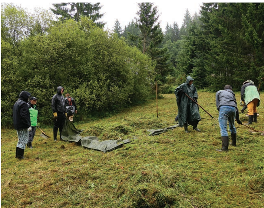
Sekání mokřadní louky v Horní Černé Studnici