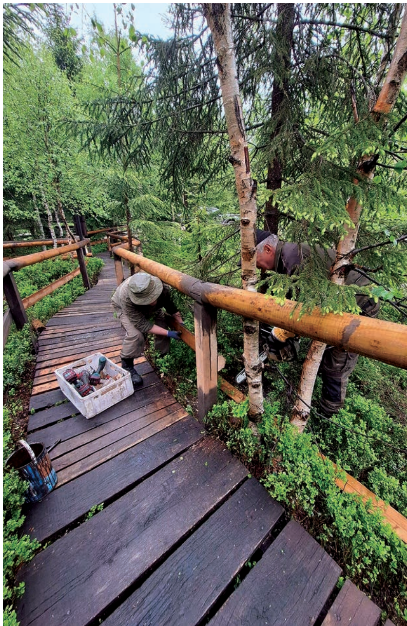
Údržba zábradlí a povalových chodníků v PR Na Čihadle