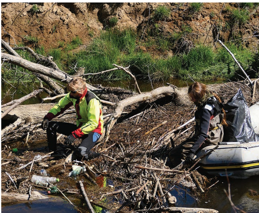
Úklid PR Meandry Smědě