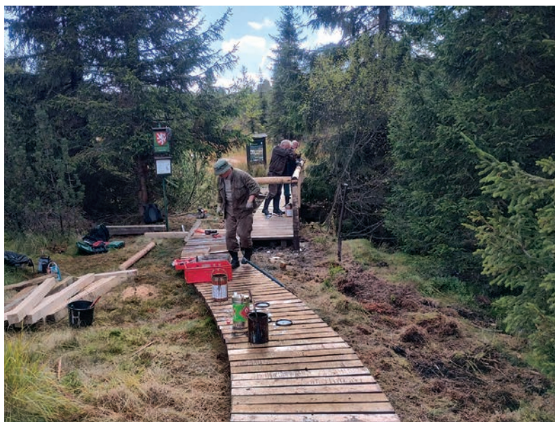
Kompletní rekonstrukce přístupové cesty v PR Černá jezírka