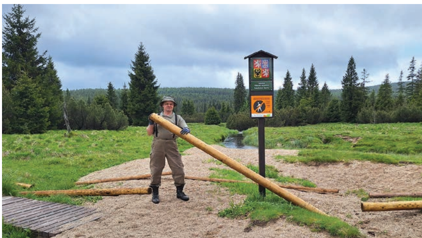
Instalace zábradlí u NPR Rašeliniště Jizerky