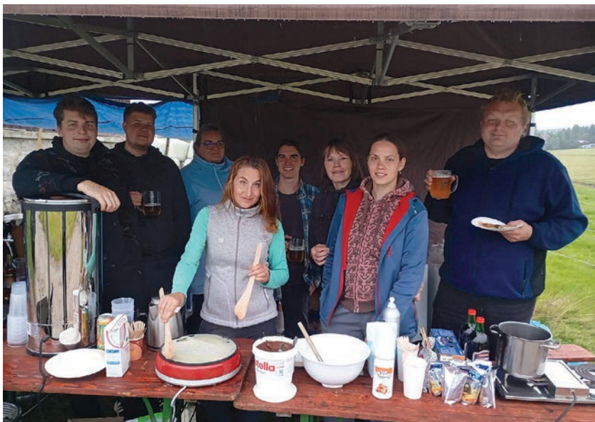
Spolkový stánek občerstvení s profesionální obsluhou na akci Den a noc na Jizerce