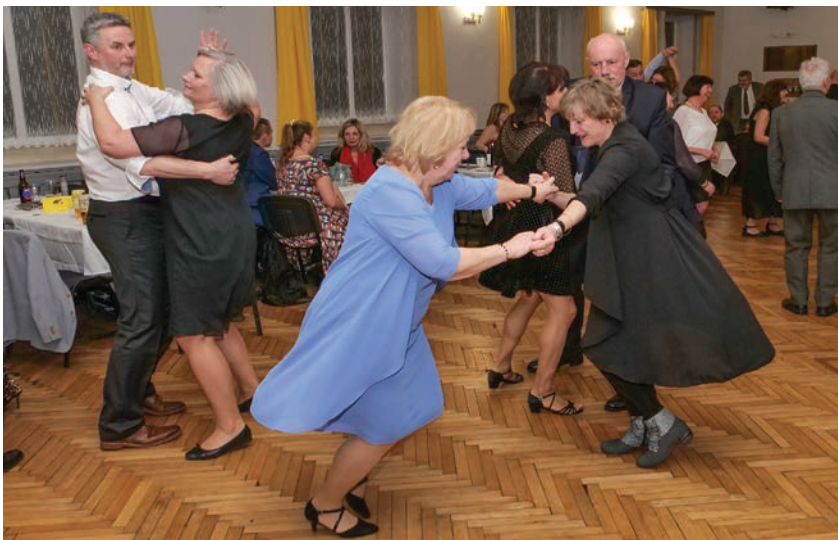
Tradiční spolkový ples opět v sále U Košků