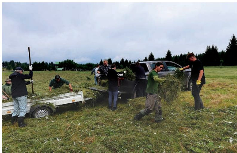
Sekání a úklid posečené trávy na Jizerce