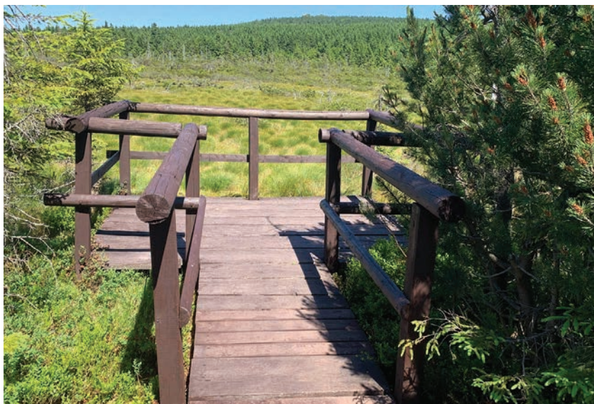
Vyhlídková plošina v PR Na Čihadle

Zejména v praktických opatřeních pro ochranu přírody rozšířil JJHS svoji působnost na téměř celé území Libereckého kraje. Svoji činnost zaměřujeme především na práci v terénu, na péči o chráněná území v Jizerských horách, na Ještědském hřbetu, v Českém ráji, Lužických horách, na Frýdlantsku i Českolipsku. Vyznačujeme hranice rezervací, kosíme horské louky se vzácnými druhy rostlin, likvidujeme nepůvodní invazní rostliny, vytváříme nové biotopy pro vodní a mokřadní faunu i flóru, budujeme a udržujeme zařízení k usměrnění pohybu návštěvníků, stavíme oplocenky k ochraně lesních porostů apod. V posledních letech se podílíme na revitalizaci vybraných rašelinišť v Jizerských horách hrazením odvodňovacích příkopů, které zde byly v minulosti vytvořeny.