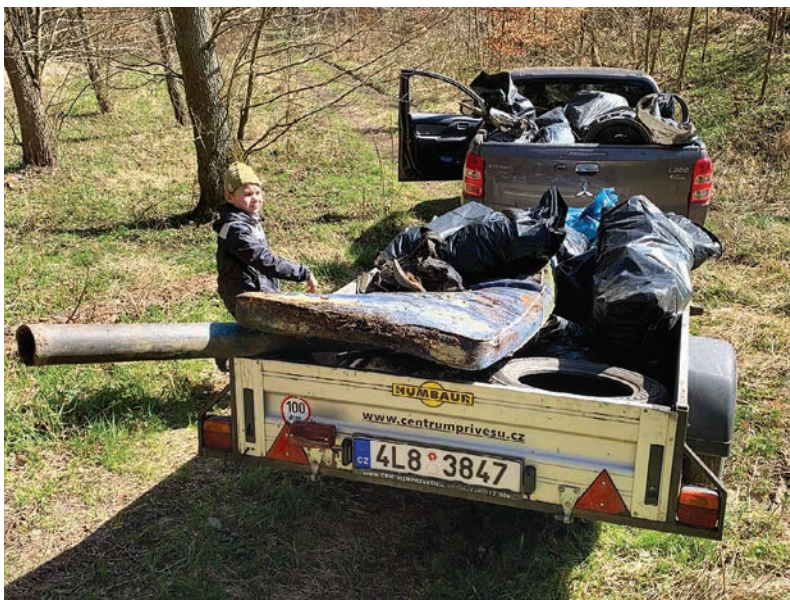
Úklid u PR Hamrštejn