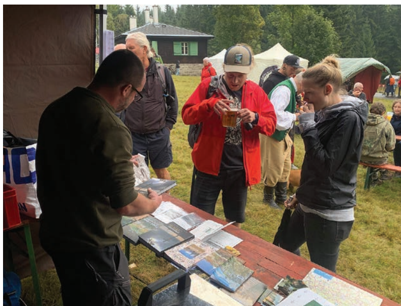
Propagační stánek spolku na sklářské slavnosti v Kristiánově