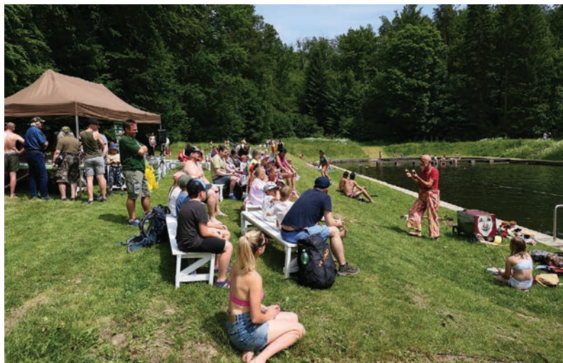
Slavnosti slunovratu na Lesním koupališti v Liberci