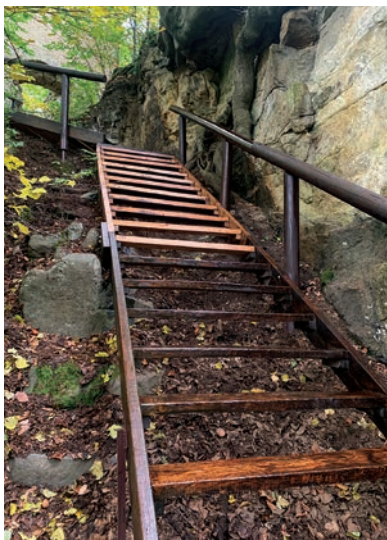
Oprava přístupového dřevěného schodiště do zříceniny hradu Děvína